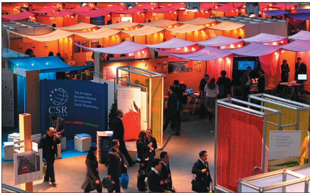
Brüsszelben évente megrendezik a CSR Europe vásárt

Magyarországon először kerül sor egy minden tekintetben rendhagyó vásárra. Május 14-én a Millenárison egy napra CSR Piac nyílik a Követ Egyesület rendezésében. Mondhatnánk akár szakvásárnak is, hiszen a társadalmi felelősségvállalás gyakorlati példáit, megoldásait mutatják be a vállalatok. De nevezhetnénk különleges szellemi műhelynek is az eseményt,